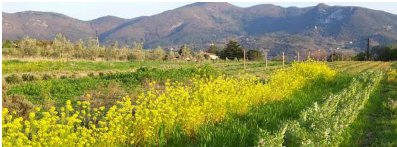
Terrain d'application pédagogique de 1.4 ha.

Le centre est labellisé H+ pour l'accueil des personnes en situation de handicap. Merci de nous contacter pour tout besoin spécifique.